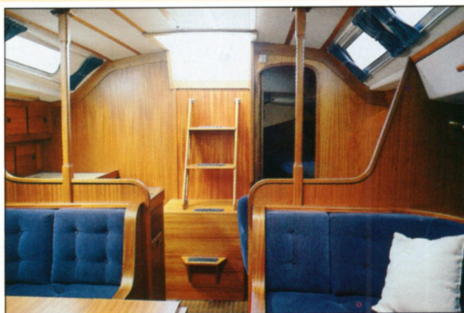
A view of the Owners Cabin from the salon. The true pleasure of privacy at sea. Ein Blick in die Kabine des Schiffseigners vom Salon aus. Die absolute Freude der privaten Atmosphäre auf See.

Es ist also nicht von Bedeutung, ob Sie eine herausfordernde Segelregatta vorziehen oder erholsame Ferien auf See: eine Sweden Yachts 36 ist die Antwort.