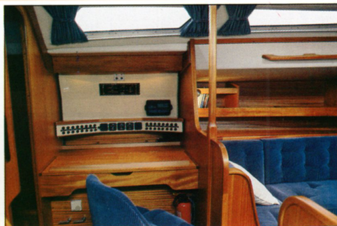
Plenty of room for instruments and maps in the navigation area. Genügend Raum für Instrumente und Kartenmaterial im Navigationsbereich.

Die Kabine des Schiffseigners. Ihre "private Zuflucht" an Bord. Erholen Sie sich entweder im Doppelbett oder auf der Einzellege.