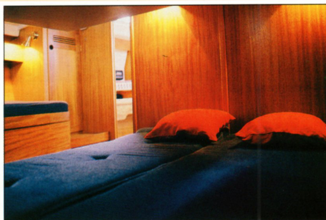
The Owners Cabin. Your private retreat on board. Relax in either the double bed or the single berth.

Die Kabine des Schiffseigners. Ihre "private Zuflucht" an Bord. Erholen Sie sich entweder im Doppelbett oder auf der Einzellege.